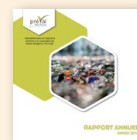
Rapport annuel 2016