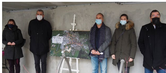
Les élus et partenaires, réunis autour du plan du réseau

Véritable chauffage central à l'échelle de Pontarlier, le réseau de chaleur alimente en chauffage et eau chaude sanitaire différents bâtiments avec une énergie locale dite de récupération , provenant principalement de la combustion des déchets.