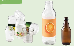
Pots, bocaux • Bouteilles