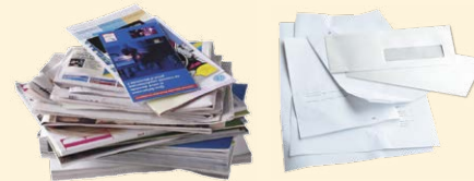
Journaux, publicités, enveloppes...