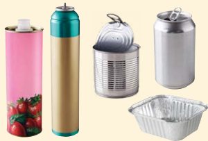
Bouteilles • Aérosols alimentaires / d'hygiène • Conserves • Canettes