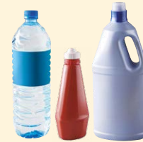
Bouteilles & flacons