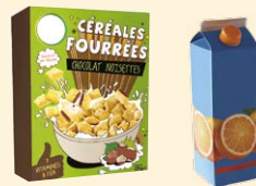
Cartonnettes • Briques alimentaires