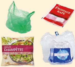
Sacs, sachets, films