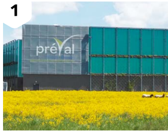
1 Nos déchets sont transportés jusqu'au centre de tri de Pontarlier.