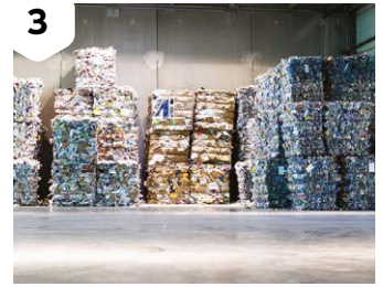
3 Mis en balles, les matériaux sont expédiés vers des centres de recyclage.