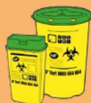
Objets piquants et coupants à risques infectueux