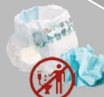
Mouchoirs, lingettes, couches