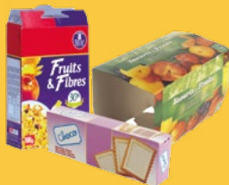
Petits emballages en carton