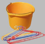
Objets en plastique