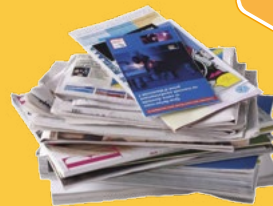
Papiers, journaux, publicités, enveloppes, livres...