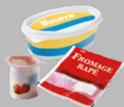
Pots et barquettes en plastique