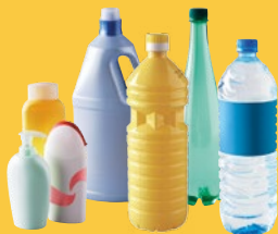
Plastique : Bouteilles / flacons uniquement

Nous pourrons d'ici quelques années, trier et recycler tous les emballages en plastique !