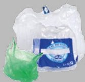
Sacs et films en plastique