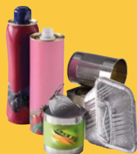
Emballages métalliques (boîtes de conserve, canettes...)